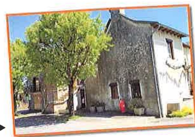
Grange des Tilleuls ▶