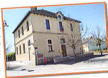
◀ Place de la Mairie

Aussi la commune a intégré le groupement de commande du SMAEP de Montbazens Rignac pour l'entretien afin d'en réduire le coût.